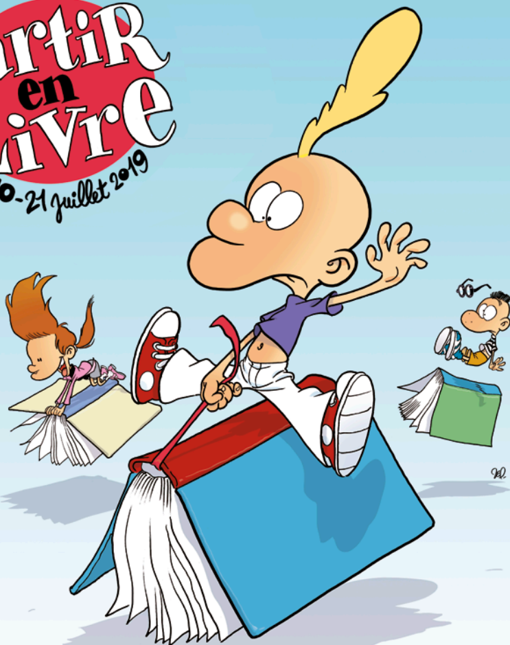
Illustration : Zep pour Partir en Livre 2019